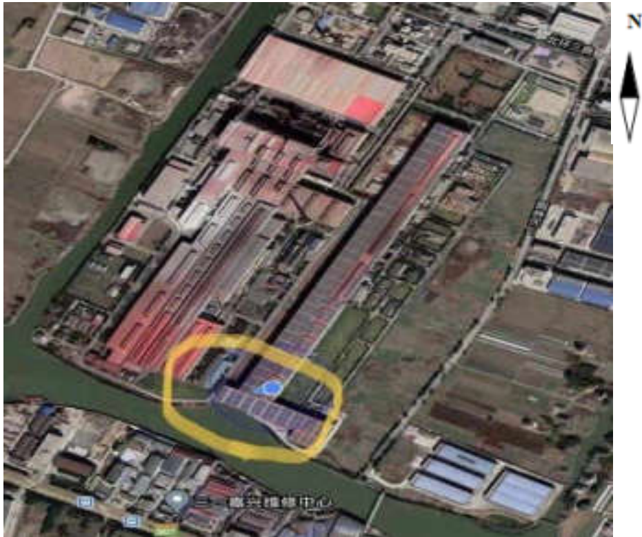
图 3-1 项目地理位置图