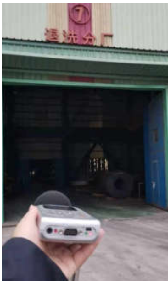
厂界噪声现场监测图