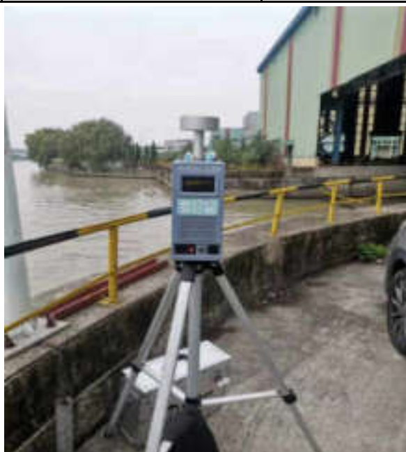
无组织废气现场监测图